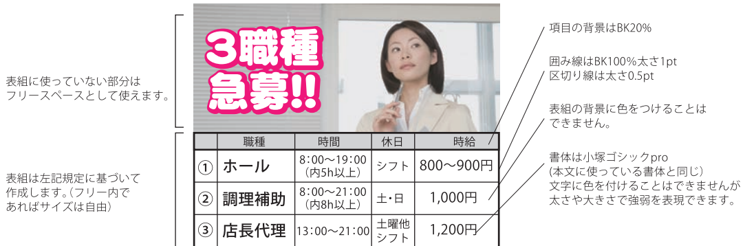
フリースペース (A) の場合